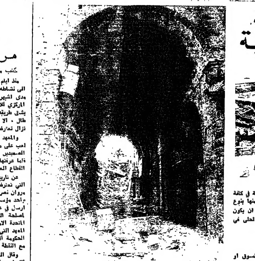
احد ائمة السوق اللبنانية